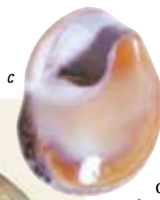
2. LES PERLES EN FORME DE PANIER étaient abondantes pendant l'Aurignacien, les vestiges (a) de l'abri Castanet, en Dordogne, en témoignant (le diamètre moyen des perles est de six millimètres). Sur l'une des perles (b) découvertes dans l'abri Blanchard, en Dordogne, on remarque la surface lustrée par un polissage intense (elle mesure un centimètre de diamètre). Par leur forme, par leur taille, et après ce polissage, les perles ressemblent étonnamment à un coquillage méditerranéen, Cyclope neritea (c).

percées. Ce large corpus d'ornements personnels, qui succède à une quasi-absence pendant le Moustérien, reflète des transformations significatives dans la société humaine européenne au début de l'Aurignacien, notamment l'apparition d'identités individuelles et sociales.